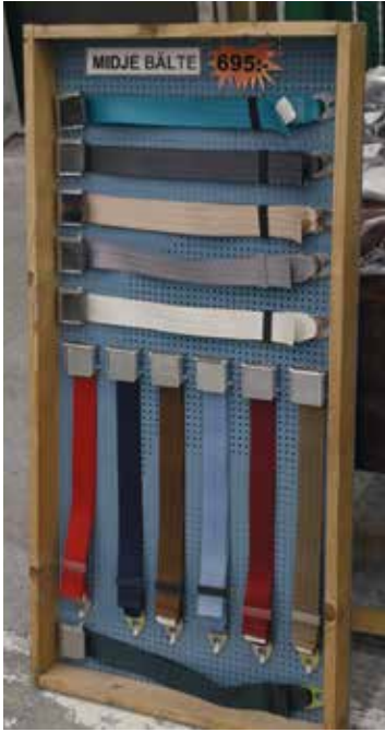
Lannevöitä eri väreissä.

Monet pohjoismaalaiset ovat löytäneet tapahtumaan tiensä. Varsinkin ruotsalaisajoneuvomerkkien omistajapiirit, koska Volvoihin ja Saabeihin sekä ruotsalaisvalmisteisiin mopoihin on ollut sopivasti osatarjontaa. Tuotteita riittää pengottavaksi kyllä muidenkin ajoneuvojen harrastajille. Lisäksi myynnissä on jonkun verran vintage-esineistöä kuten vanhoja ajoneuvoleikkikaluja, autokilpailujen julisteita sekä aiheeseen sopivia tarroja, myyntiesitteitä ja kirjoja.